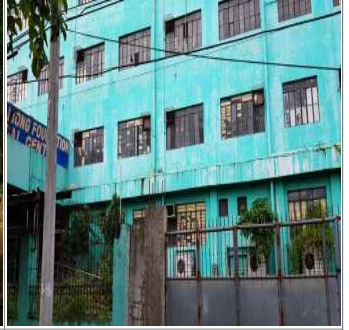
화장시설 예정부지 (병원 건물 재건축 후 진행)