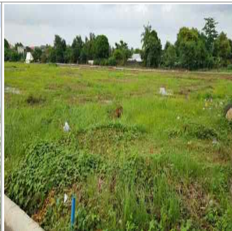
바콜로드 장사시설 예정지