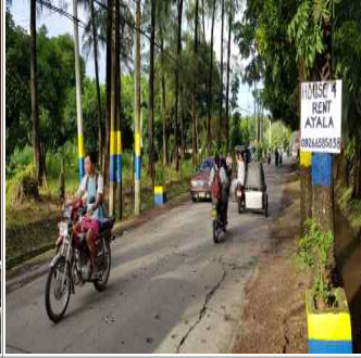
화장시설 예정부지 도로