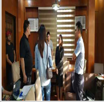
영락공원 소개 및 업무협의