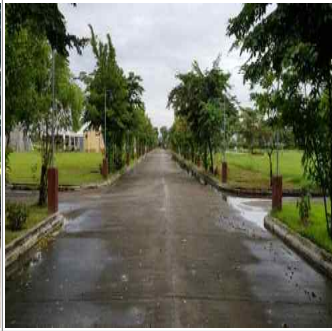
The Lord is My Shepherd Memorial Park 부지 견학