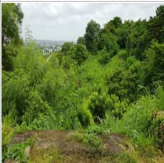
노벨레타 장사시설 예정지