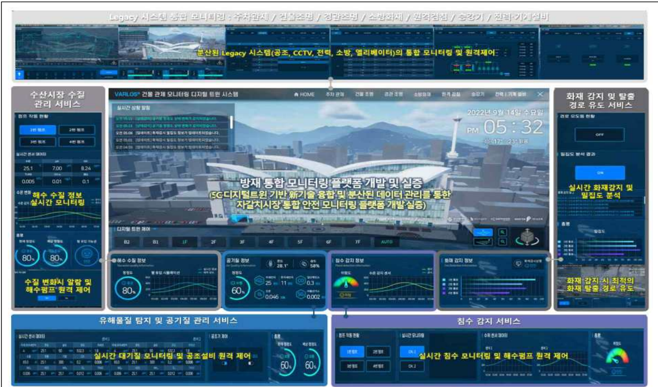
방재센터 실시간 안전관리 시스템 모니터링 화면