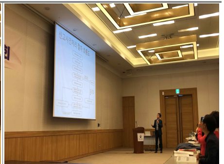
신고자 보호·보상, 신고처리 절차 안내