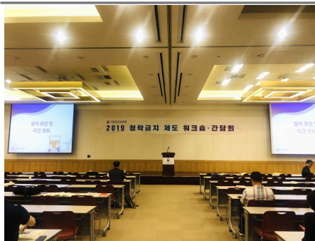
2019 청탁금지제도 워크숍·간담회